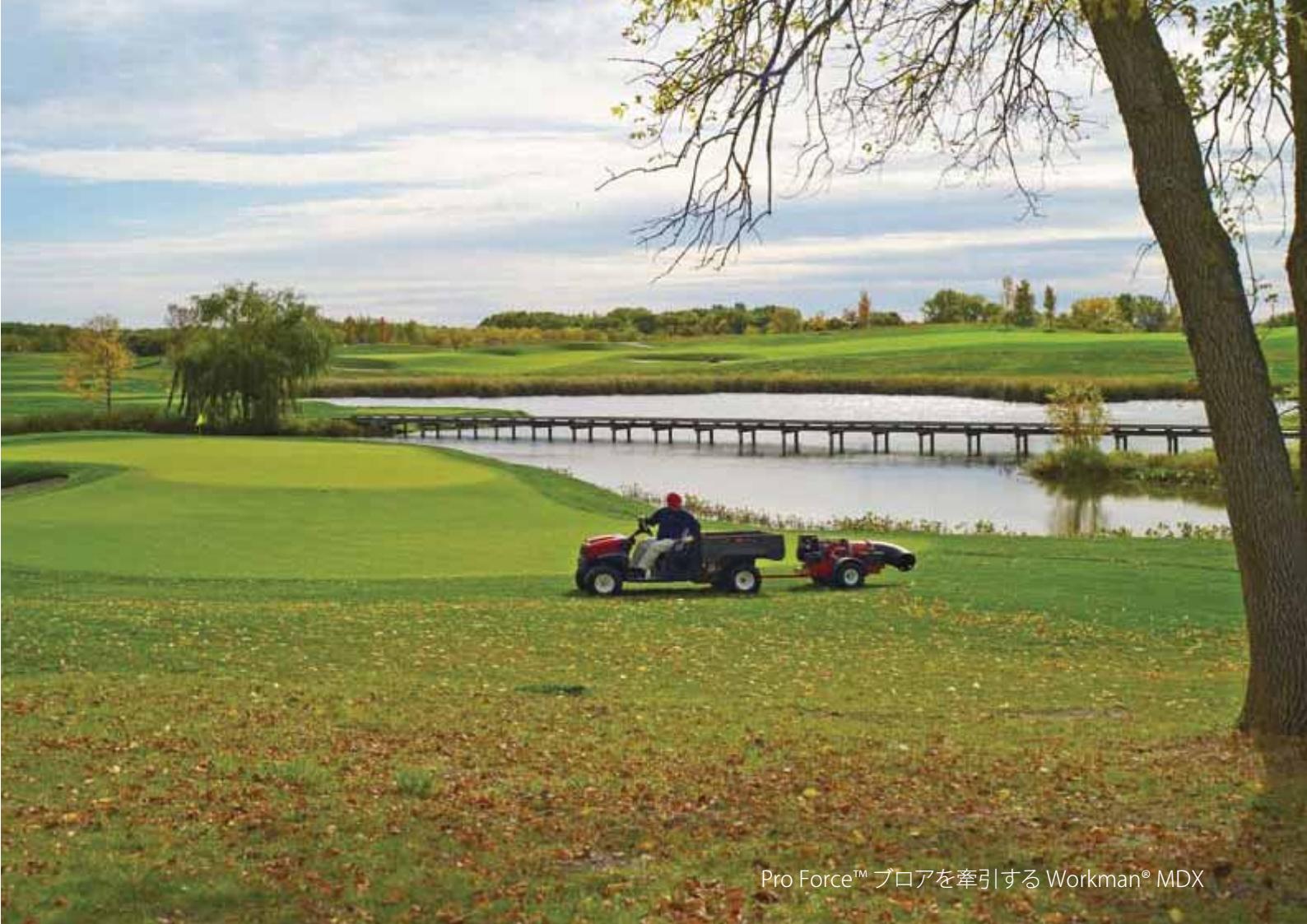
Pro Force™ ブロアを牽引する Workman® MDX