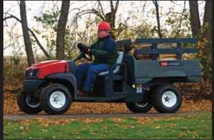
荷台用支柱キット