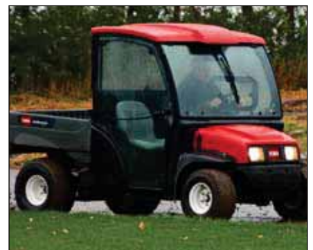
デラックス・ハード・キャブ (ドアは含まれません) | 07328