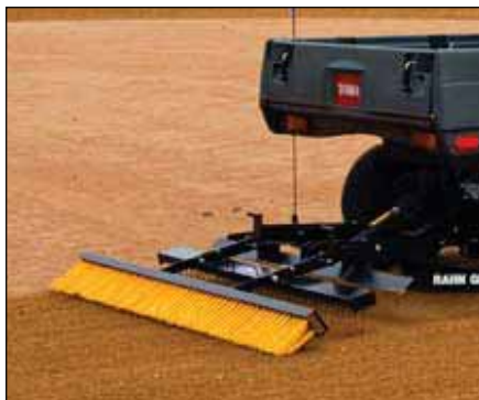
Rahn®グルーマ | 提携会社製品