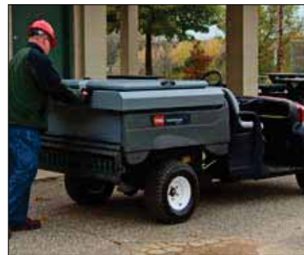
移動式ドリンク・バー | 07298