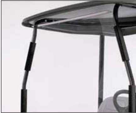
固定式ウインドシールド | 07325