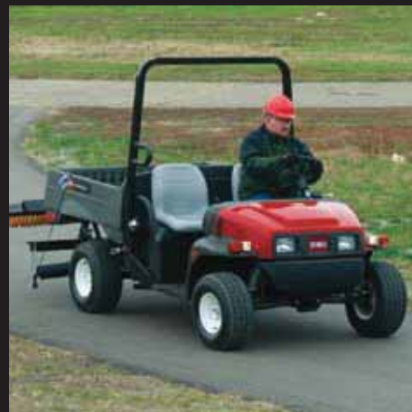
ブレーキ, テールウインカー・ランプ