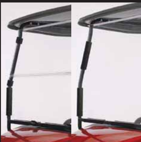
折り畳み式または固定式風防窓