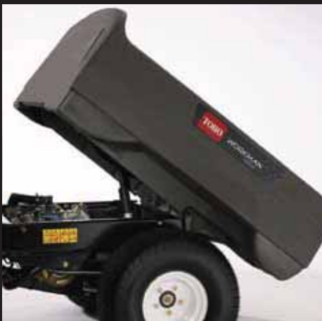
電動式荷台昇降装置