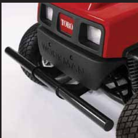
ヘビー・デューティー・バンパー