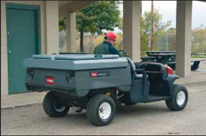
ポータブル・ドリンク・バー