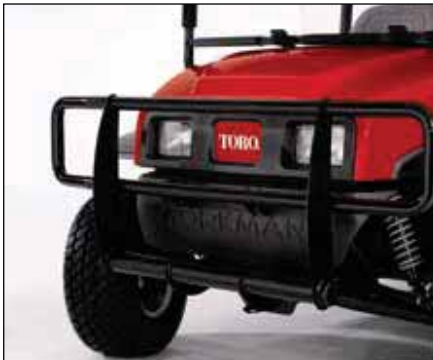
ブラシ・ガード | 07338