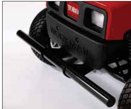
ヘビー・デューティー前バンパー | 07329