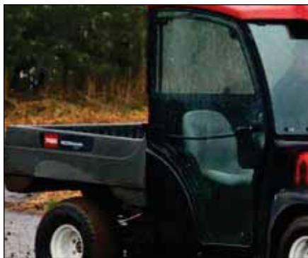
固定ウインドウ・ドア・キット (デラックス・ハード・キャブ用) | 07353