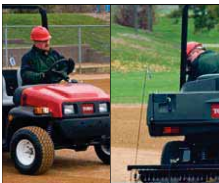
ブレーキ/テール/指示器キット | 115-7749 MD & MDX / 107-8020 MDE