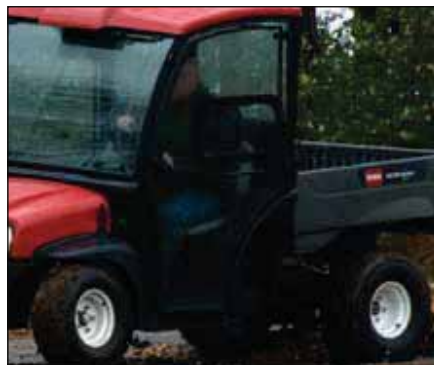
固ライド式ウインドウ・ドア・キット (デラックス・ハード・キャブ用) | 07352