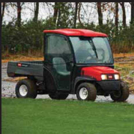
デラックス・ハード・キャブ

Toro® Workman® MD シリーズには豊富なアクセサリが揃っていますからシーズンを通してほとんどどんな仕事にも出動が可能です。デラックス・ハード・キャブ、屋根、前面風防などを装備すれば、強烈な日照などの厳しい天候条件下の作業も楽になります。非常に厳しい作業条件での作業には、横転保護バー (ROPS)、ブラシ・ガード、ヘビー・デューティー・バンパーがあります。デラックス・ドリンクバーまたはポータブル・ドリンクバーを搭載すれば、ワークマンが移動式の売店に早変わりします。