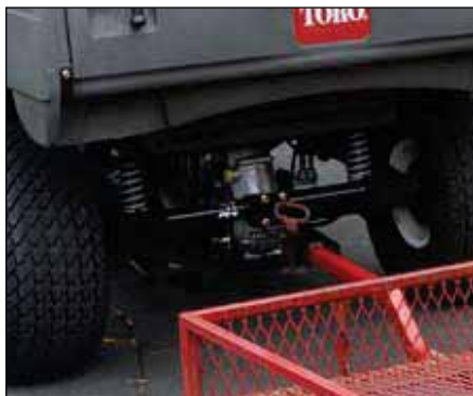
ヘビーデューティ牽引レシーバ・ヒッチ | 07278