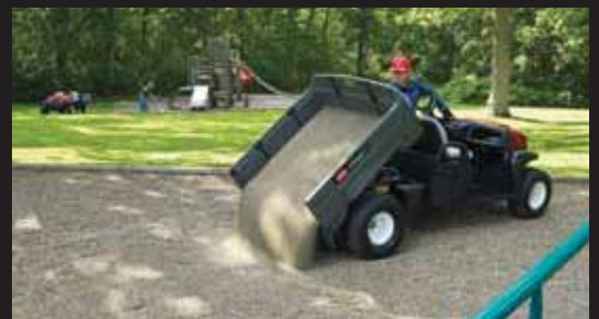
金属製の荷台のようにサビたり、へこんだり、騒音が大きかったりせず、しかも毎日の酷使にしっかり耐える、ポリエチレン樹脂製 2 重壁荷台。