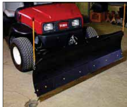
除雪板 | 07327