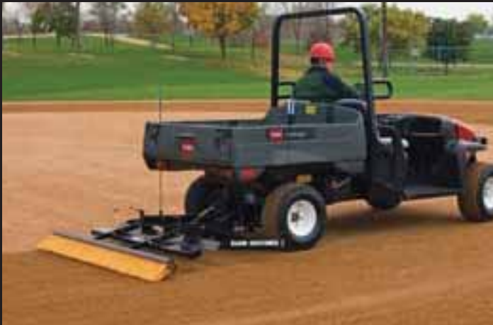
ラーン社製グレーマ