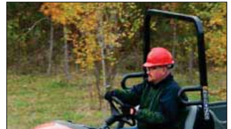
ROPS | 07276