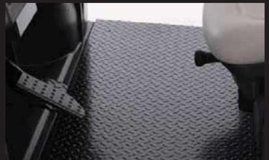
見た目も実際にもがっちりしたスチール製のダイヤモンド・プレート製のフロア。

作業車の比較検討を行なうときの最終的な決め手は乗り心地と作業能率でしょう。だから、SRQ™ も重要ですが、ワークマン MD シリーズには最大積載可能重量が 567 kg もある頑丈なプラスチック製荷台がついているのです。牽引能力も最大 545 kg ありますから、作業機械を現場に牽引するといった作業も余裕で行えます。そして、制動に関しては四輪油圧ブレーキを装備。重い砂を運ぶときでも、大きな機械を牽引するときでも、ワークマンはパワフルで頼りになる働き手です。