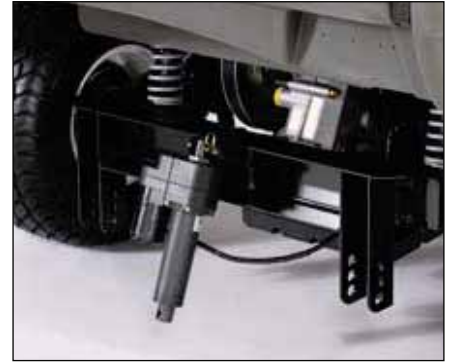
後部リフト・キット | 07334 MD & MDX/07261 MDE