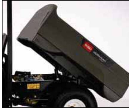
電動荷台リフト | 07335 MD & MDX/07263 MDE