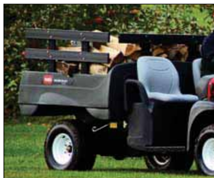
側柱キット | 07290