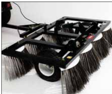
人工芝コンディショナ | 08791