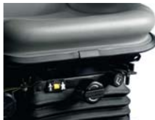
エアクション式 シート・サスペンション