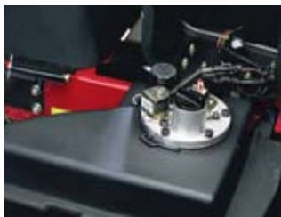
TurfDefender™ リーク・ディテクタ