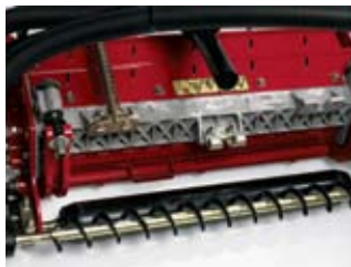
パワー・リア・ローラ ブラシ・キット