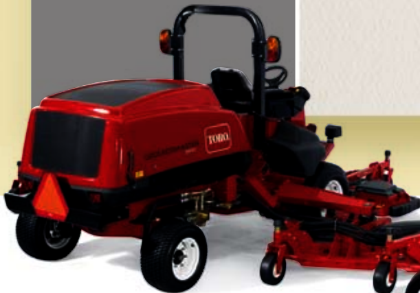
グランドマスター 5900