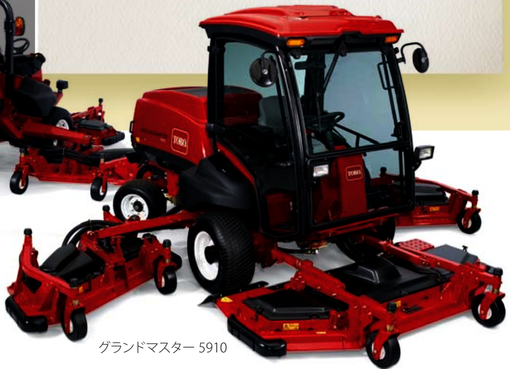
グランドマスター 5910